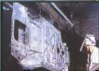
Primeira pintura em spray de um carro no interior de Curitiba em 1973. O lote era composto por 100 unidades.