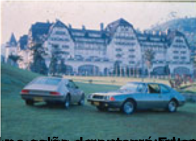
SM recebe o primeiro lote de carros montados no interior de Curitiba em 1973. O lote era composto por 100 unidades.