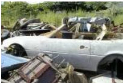
ou 6000. Só no lançamento em 1976 conversível