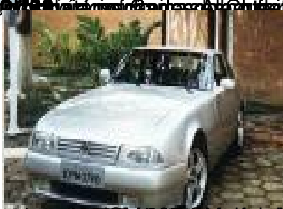
o primeiro SM conversível lançado em 1976