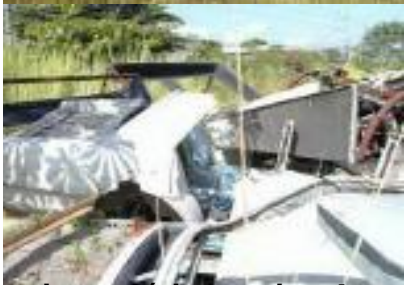
que sobreviveu após a queda de 4 metros. O primeiro SM conversível lançado em 1976